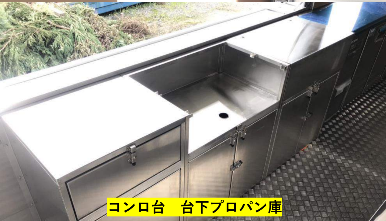
コンロ台 台下プロパン庫