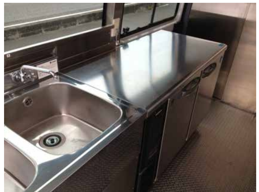
コールドテーブル HOSHIZAKI 冷凍冷蔵庫 RFT-120PNE1