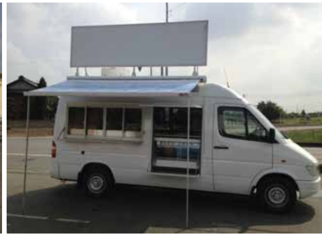
看板、オーニング展開時