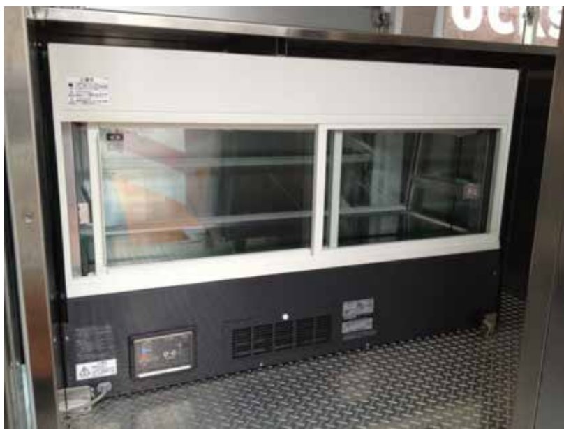
高湿ディスプレイケース HOSHIZAKI HKD-4B-W