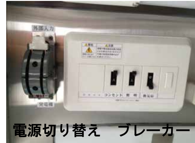
電源切り替え ブレーカー