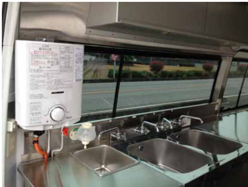
2層+手洗いシンク 給湯器