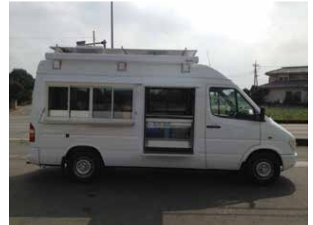
販売カウンター、ショーケース カウンター展開時