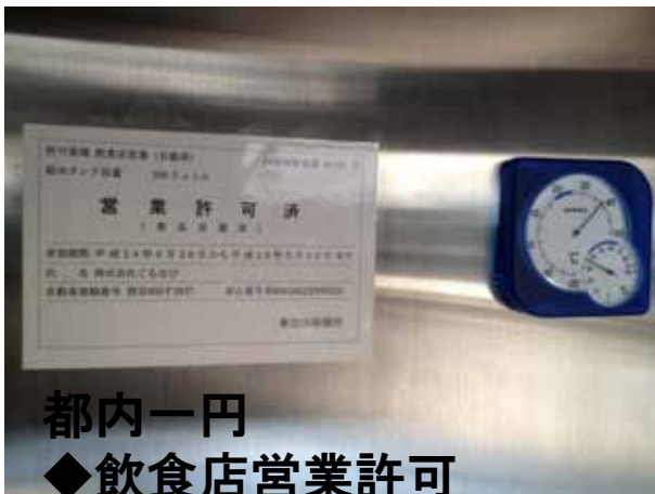
都内一円 ◆飲食店営業許可