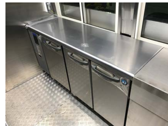
コールドテーブル ホシザ RFT-150MTF-ML