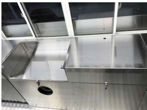
コンロ台×2作業台として使用可能