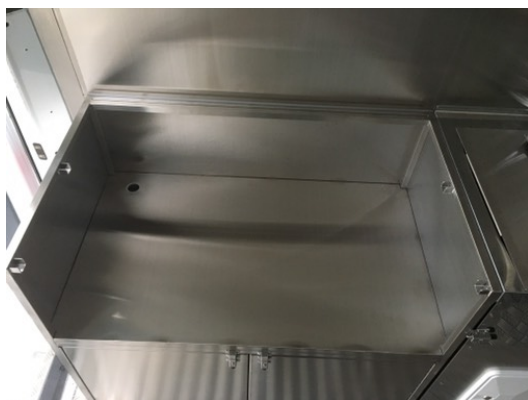
大型コンロ台(グリドル、卓上フライヤー用) ※蓋を閉じれば作業台として使用可