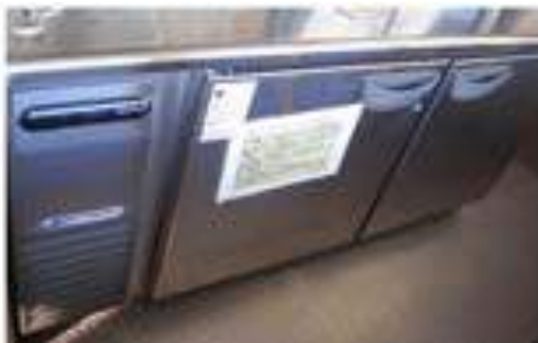
コールドテーブル