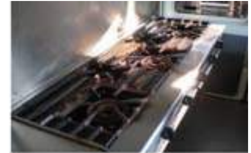
業務用5口ガスコンロ SUNWABE S-GTC-156