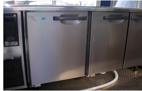
コールドテーブル 冷蔵133L冷凍70L