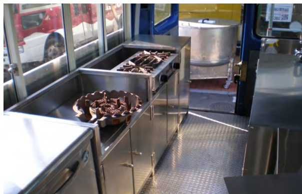
コンロ台 ※写真は2口コンロ+業務用2重鋳物コンロ