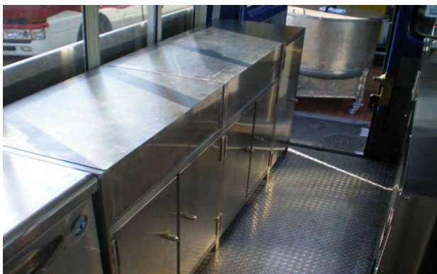
コンロ台を作業台として使用可能