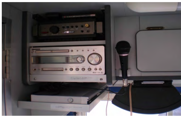
PA(追加オプション) お気軽にご相談くださいませ