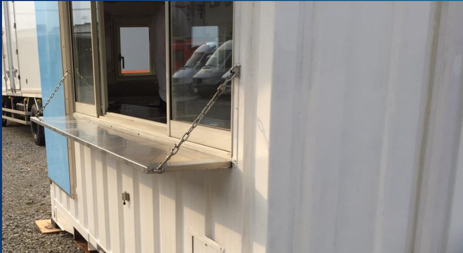
販売カウンター つりさげ式