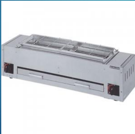
ガス焼物器 マルゼンMGK-204B