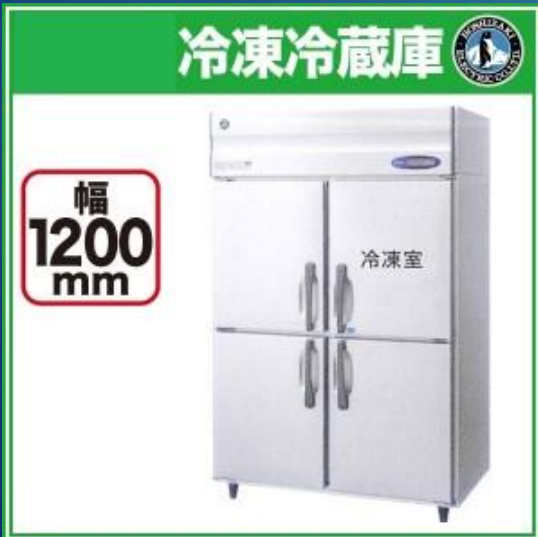
4尺業務用冷凍冷蔵庫 (ホシザキ)