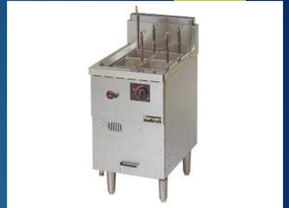
業務用ガス茹で麺器