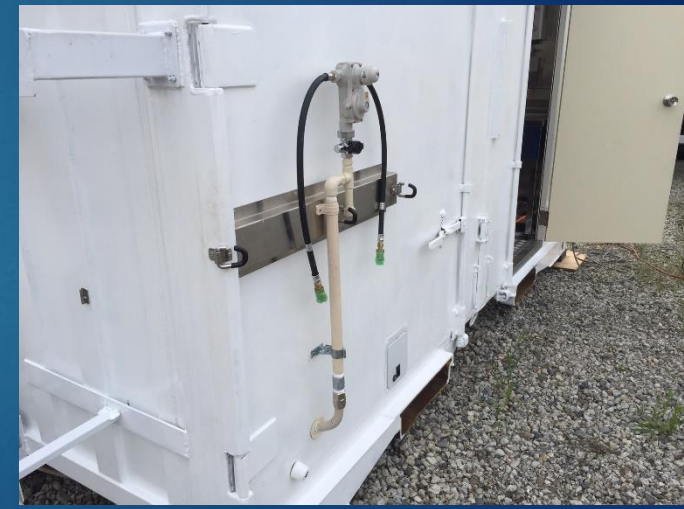
L P ガス50kg 固定フック