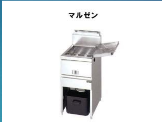
業務用ガスフライヤー