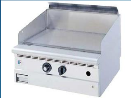
業務用ガスグリドル