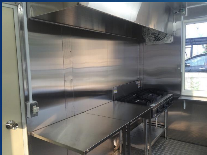
折りたたみ作業台 業務用換気扇