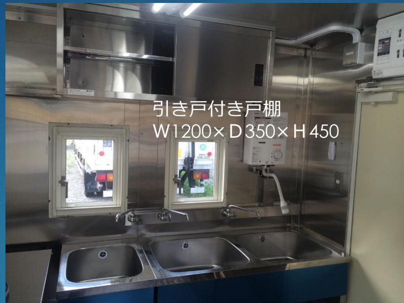
2層シンク+1層シンク 2層シンクサイズW525×D475×H205 手洗いW375×D450×H205