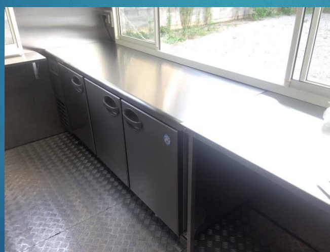
コールドテーブルW1800×D600 (冷凍124ℓ、冷蔵265ℓ)