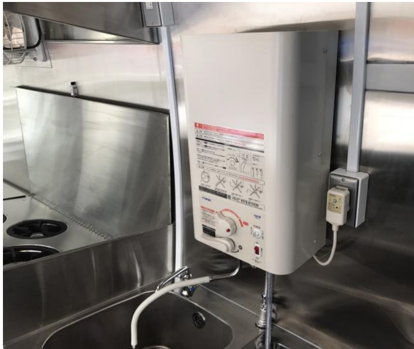
分電盤 インバータ 電気給湯器