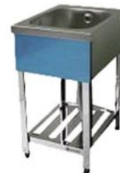
画像は HPC2-1200 です。実際の商品サイズは、寸法図でご確認ください。