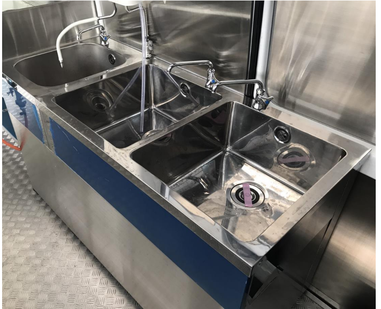
2層シンク+手洗いシンク