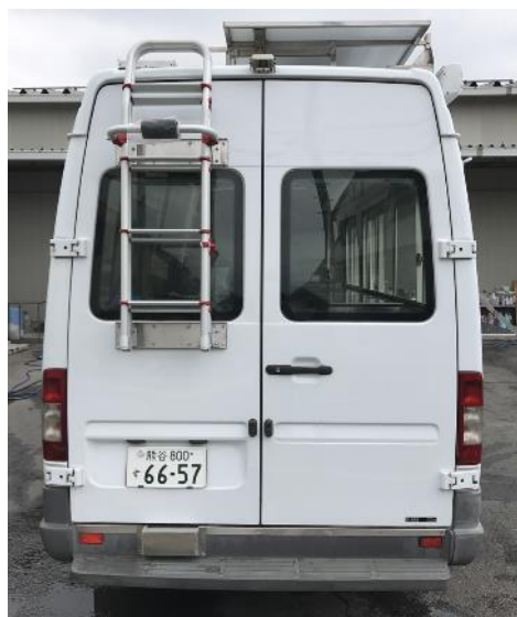
ベンツちょい長II号 (熊谷800 す 6657) 長さ：672 幅：199 高さ：289 ※要中型免許