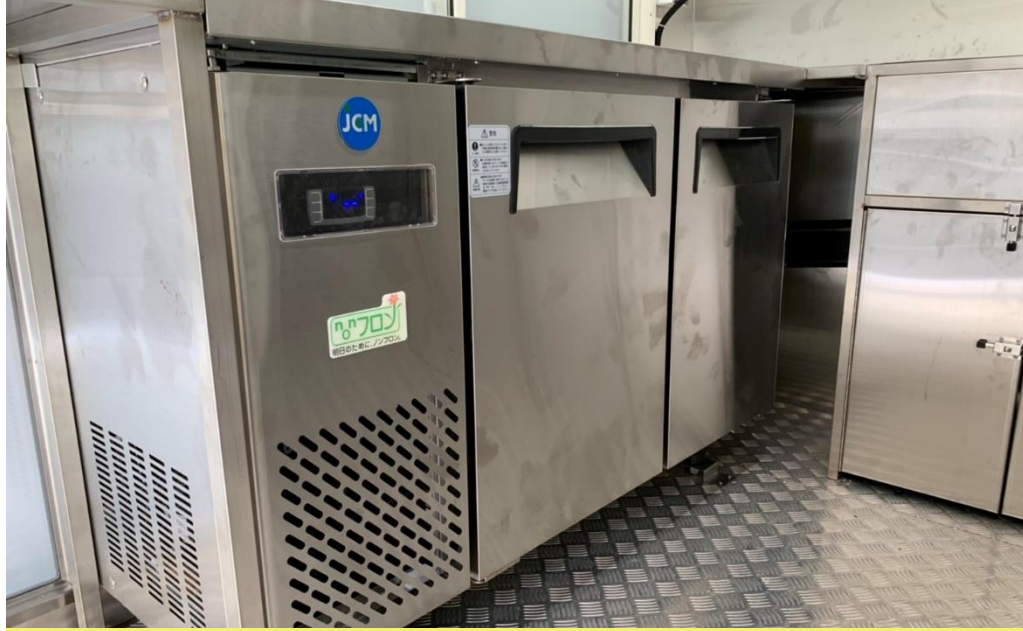
冷蔵コールドテーブル