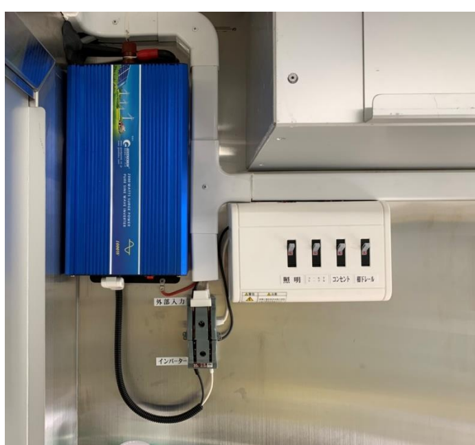
分電盤 インバーター