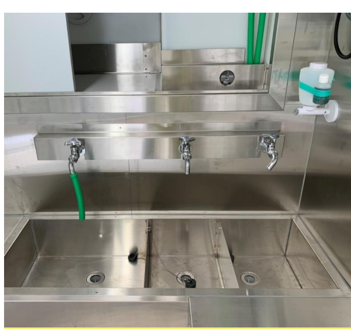
2層シンク + 手洗いシンク