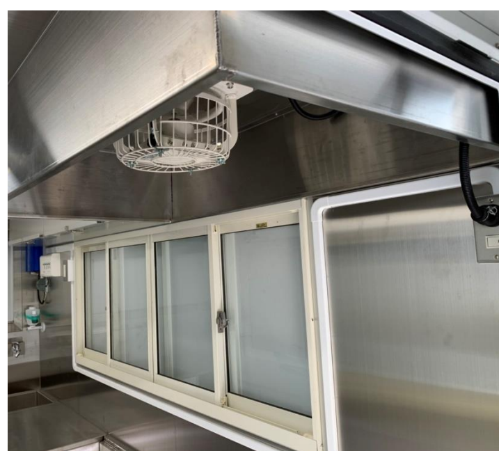
フード付き換気扇