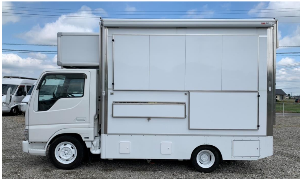
提供面ラッピングパネル