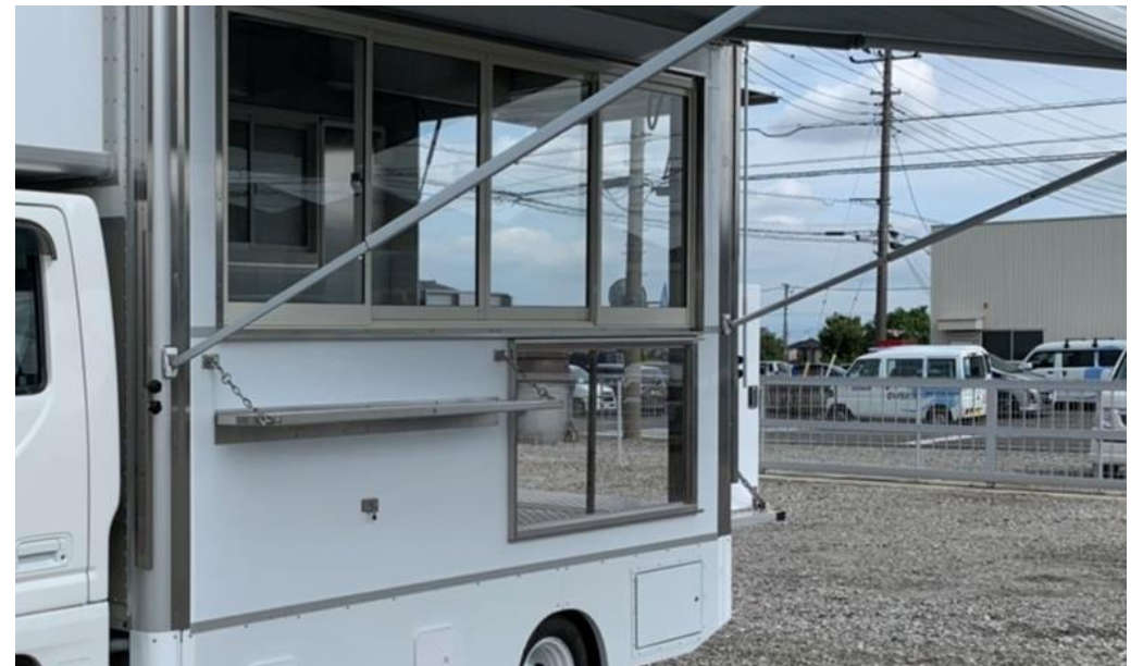
提供カウンター、提供面下ショーケースウィンドウ