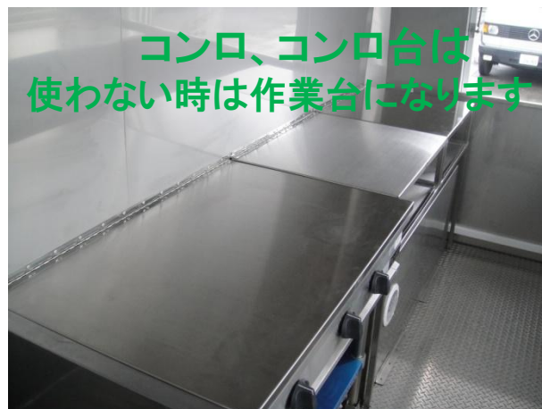
コンロ、コンロ台は 使わない時は作業台になります