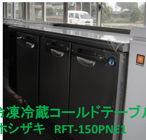
冷凍冷蔵コールドテーブル ホシザキ RFT-150PNE1