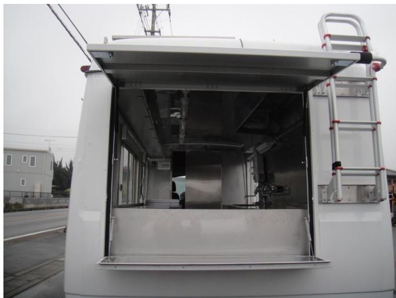
車両後部跳ね上げ式窓