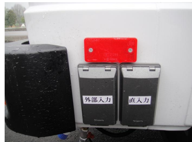
外部電源取り入れ口