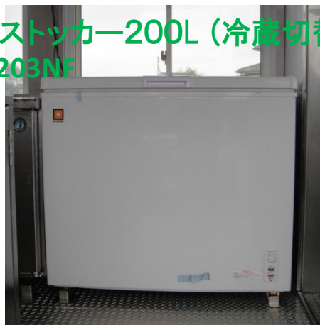
冷凍ストッカー200L (冷蔵切替え付) RRS-203NF