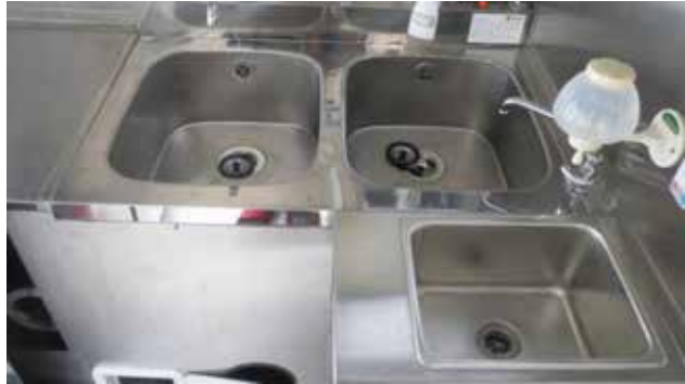
給湯器付2層+手洗いシンク