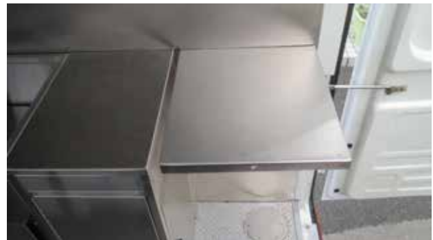
跳ね上げ式作業台