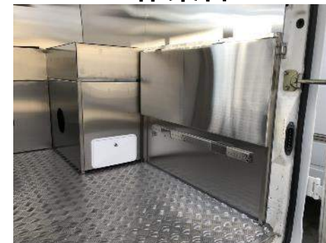
折りたたみ作業台