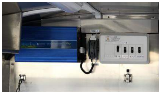
分電盤、インバータ