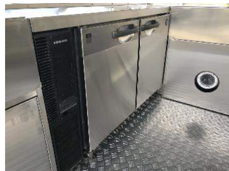
冷蔵コールドテーブル